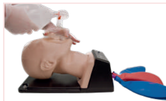
AIRSIM® ADVANCE X