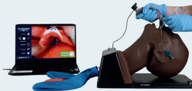
TABLEAU COMPARATIF DES SIMULATEURS • ADULTE

TruGuide est une plateforme d'apprentissage autodirigée à la gestion des voies aériennes, assistée par intelligence artificielle. Le système se connecte à un vidéolaryngoscope standard ainsi qu'aux mannequins de simulation adultes AirSim®. Il fournit un guidage en temps réel, une aide à la navigation, des repères visuels intuitifs à l'écran et des indicateurs de performance objectifs.