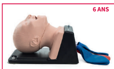
AIRSIM® CHILD COMBO X