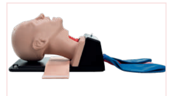
AIRSIM® DIFFICULT AIRWAY