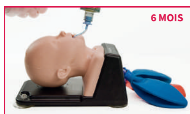
AIRSIM® BABY X