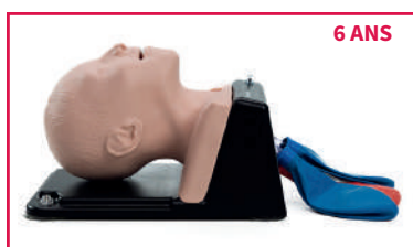
AIRSIM® CHILD X

Les mannequins AirSim® “Child” et “Baby” intègrent des voies respiratoires et une cavité nasale aux designs innovants basées sur de réelles imageries médicales (IRM patients).